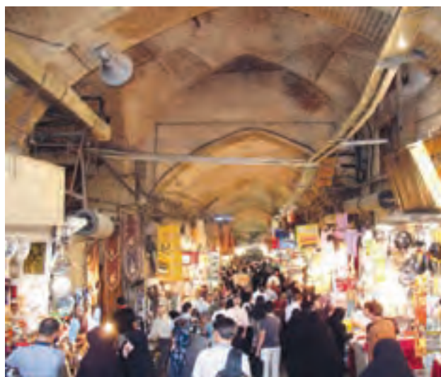
بازار فرش تبریز و بازار سرپوشیده تهران